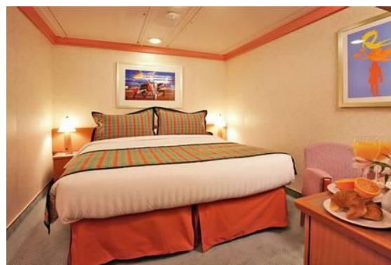
OBS: perspectiva ilustrativa da cabine interna.