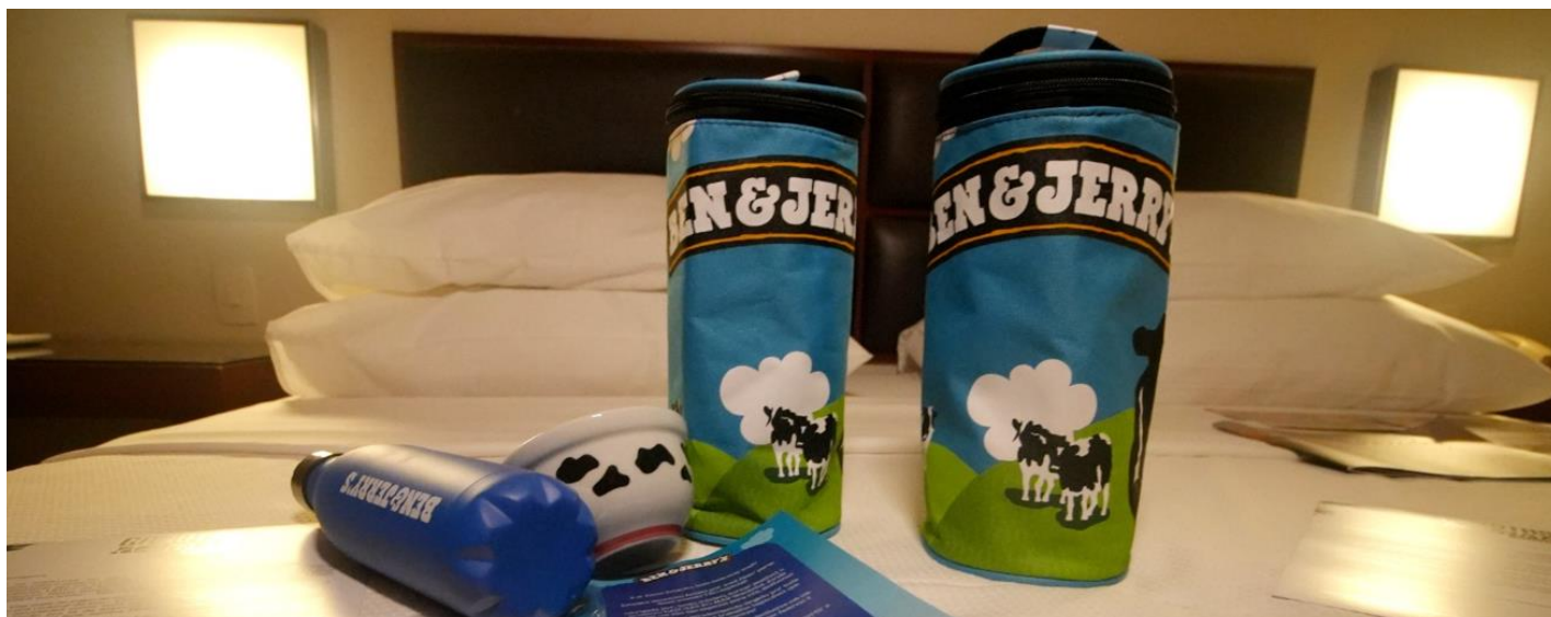
OBS: fotos ilustrativas dos Aptos Superiores (standard).

OBS: Venda dos Pacotes Promocionais de lançamento válida exclusivamente para Passageiras do GAROTAS AO MAR Weekend 2024 com pelo menos 1 passageira (titular da reserva) no mesmo apto, limitado aos primeiros 100 aptos nesta categoria ou para compras até 10 de abril de 2024 ou enquanto durar o lote promo. Produto promocional exclusivo na categoria Apartamento Superior (STANDARD), novidade de parcelamento em até 12 vezes (cartão de crédito), produto não reembolsável em caso de cancelamento. Promoção não cumulativa. Consulte as regras indicativas e o regulamento do festival no momento da compra.