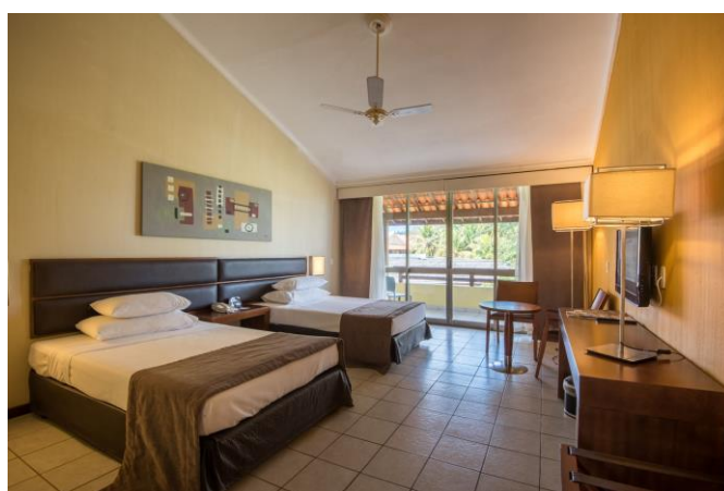
OBS: fotos ilustrativas dos Aptos Superiores.