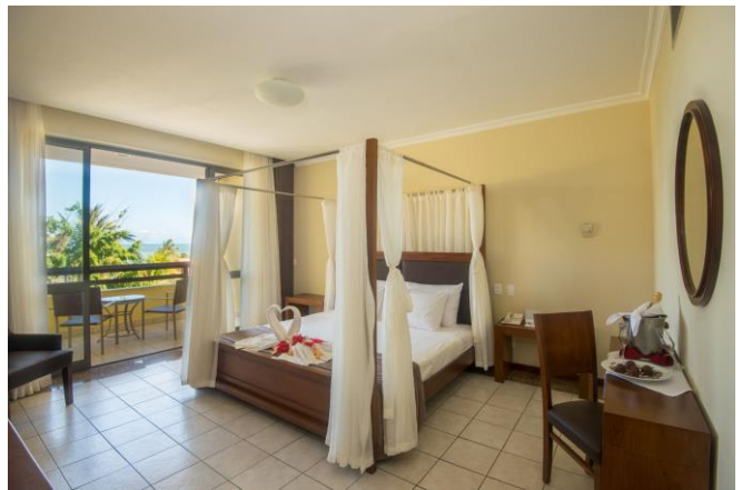
OBS: fotos ilustrativas da Suíte Presidencial.

VENDAS E INFORMAÇÕES PLANETAHH.COM.BR/GAROTAS