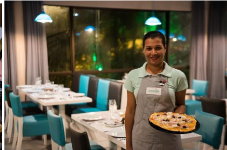
OBS: fotos ilustrativas dos Restaurantes e Bares do resort.