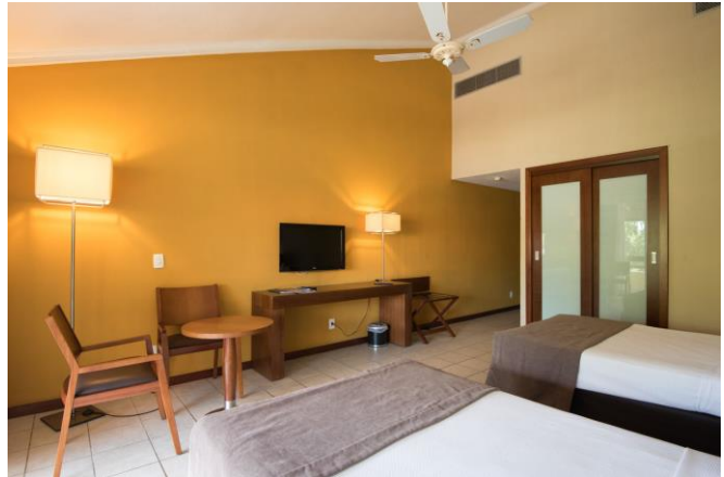
OBS: fotos ilustrativas dos Aptos Luxo.