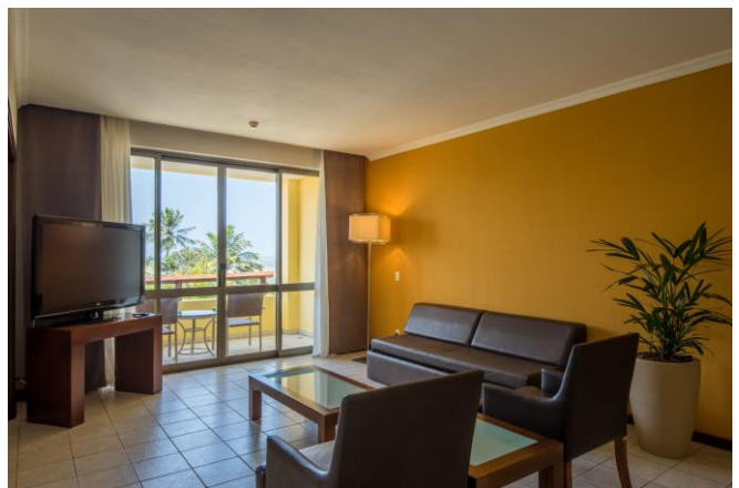
OBS: fotos ilustrativas das Suítes Master.